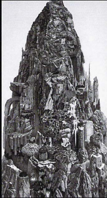
《巖ノ王》(部分)1998年 紙にペン、インク / おぶせミュージアム・中島千波館蔵