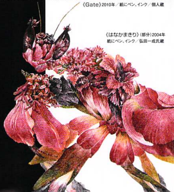
《はなかまきり》(部分)2004年 紙にペン、インク / 弘田一成氏蔵