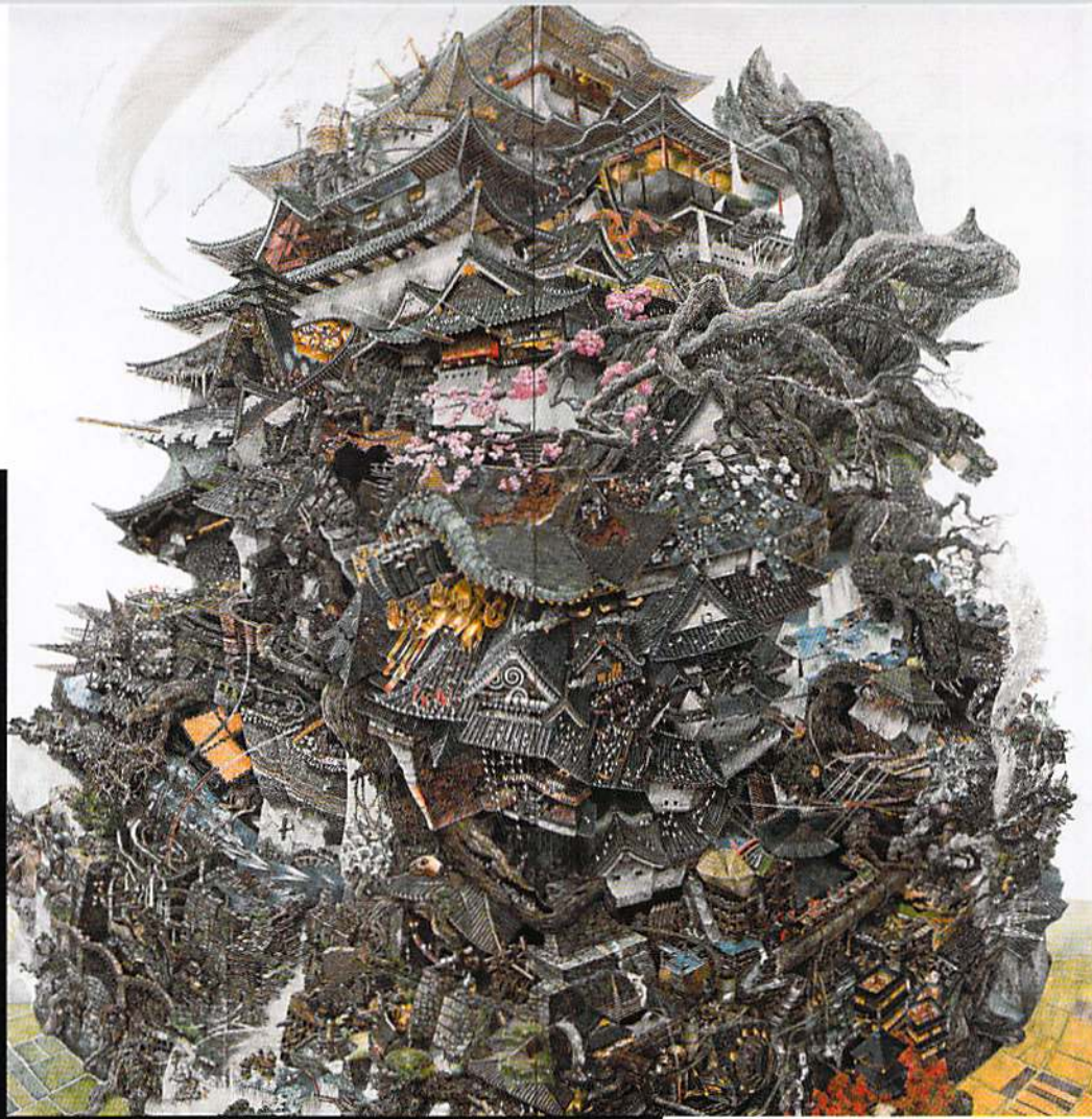
《興亡史》2006年 / 紙にペン、インク / 高橋コレクション蔵

1998年に東京藝術大学美術学部デザイン科卒業。 2011年より文化庁芸術家在外研修員としてカナダ バンクーバーに滞在。2013年よりアメリカ・ウイス コンシン州にあるチェゼン美術館の招聘を受け、 滞在制作を行う。第25回(2014年度)タカシマヤ文化 基金タカシマヤ美術賞受賞。